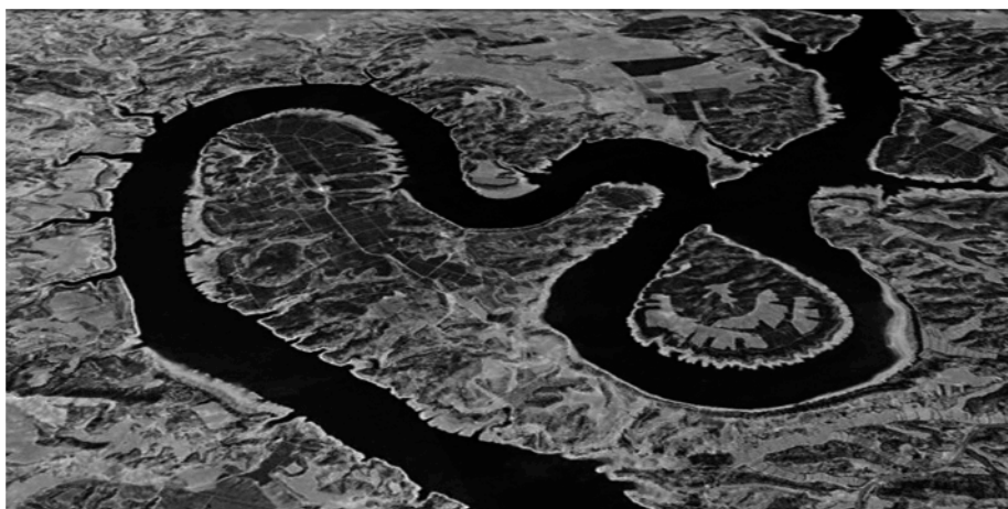
Vista aérea del paraje de La Herradura