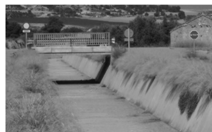
Canal de Caspe.

En cuanto al Canal de Caspe, o de la Colomina, se construyó entre 1960 y 1965, sin llegarse a usar, lo que llevó a su deterioro por abandono. Entre 1999 y 2003 se demolió para hacer uno nuevo, ya que el viejo era inutilizable. A principios de 2009 se reunió la Comisión Técnica Mixta,