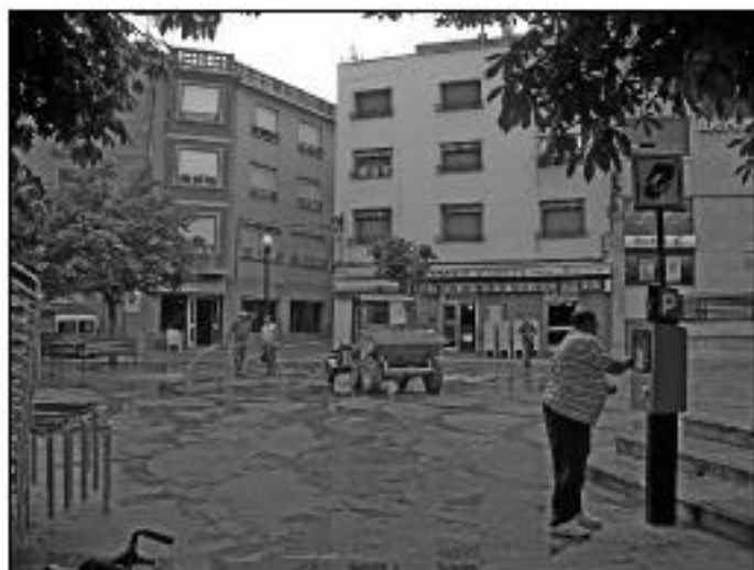
Parquímetros en la zona azul. Al fondo, la brigada de limpieza

En estos veintiséis meses ha habido de todo: bueno, regular y malo. →