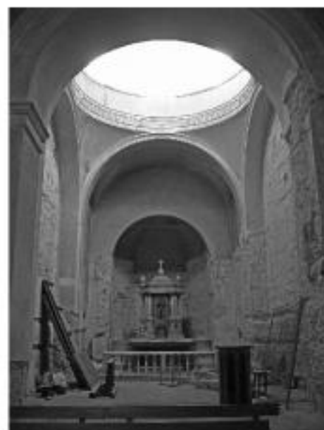
Capilla de la Veracruz, a punto para su restauración