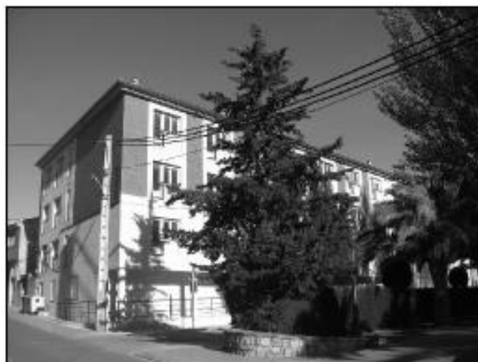
Residencia de la Tercera Edad, ya finalizada