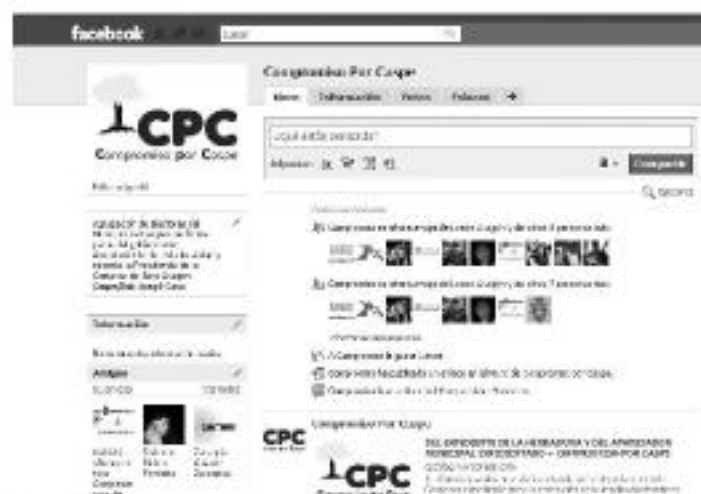
CPC en Facebook