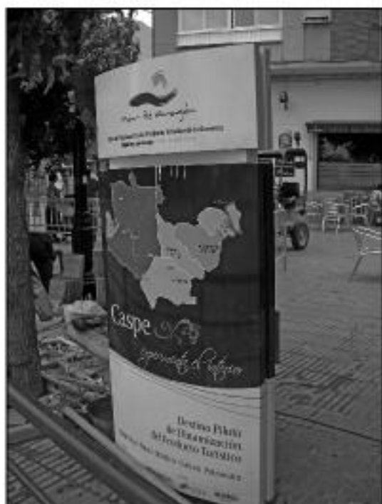
Panel de rutas turísticas. Plaza Aragón de Caspe