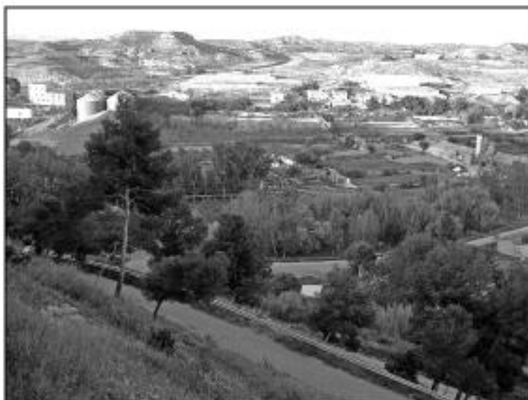
Huerta de Caspa.

Y aquí quiero poner el acento. ¿Cómo es posible que en unos casos se aplique la normativa a rajatabla y en otros se salten los trámites imprescindibles?