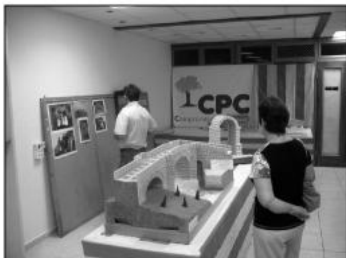
Maquetas y exposición de fotos antiguas en la sede social