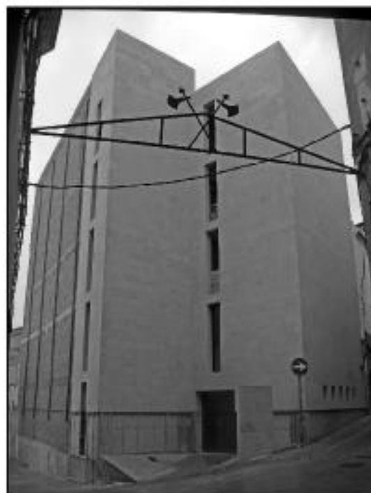
Oficina Comarcal de Turismo y Espacios Museísticos