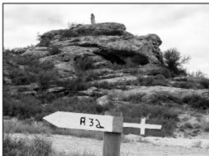
Señalización de rutas turísticas