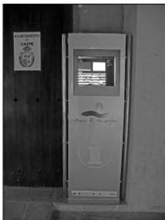
Pantalla de información táctil