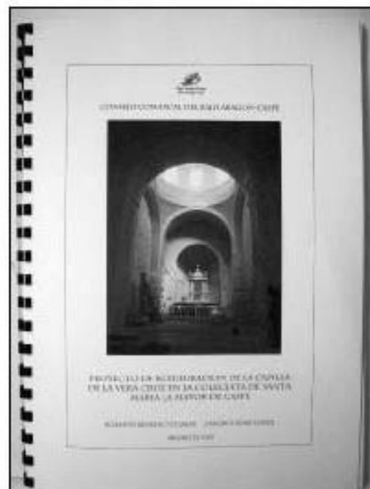
Proyecto de restauración Capilla Veracruz