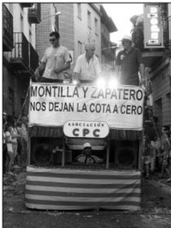
Carroza reivindicativa contra los transvases encubiertos. Agosto 2009.